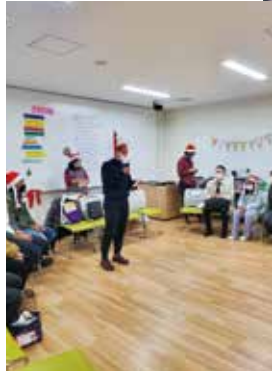
クリスマス会で 輪投げゲームを楽しむ 学習者とボランティア