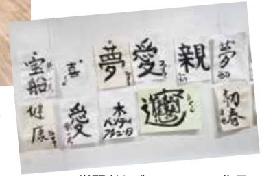
学習者とボランティアの作品