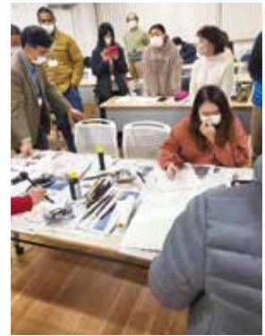
書初めに挑戦する学習者